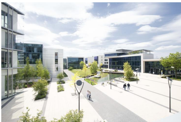
Blick auf den Sartorius Campus in Göttingen

Drei wissenschaftliche Institute und sechs Unternehmen haben in einem gemeinsamen Forschungsverbundprojekt Lösungen erarbeitet, wie sich Führung und Interaktion in Teams durch digitale Werkzeuge verbessern lassen und mehr Zeit für Führung und Zusammenarbeit bleibt.